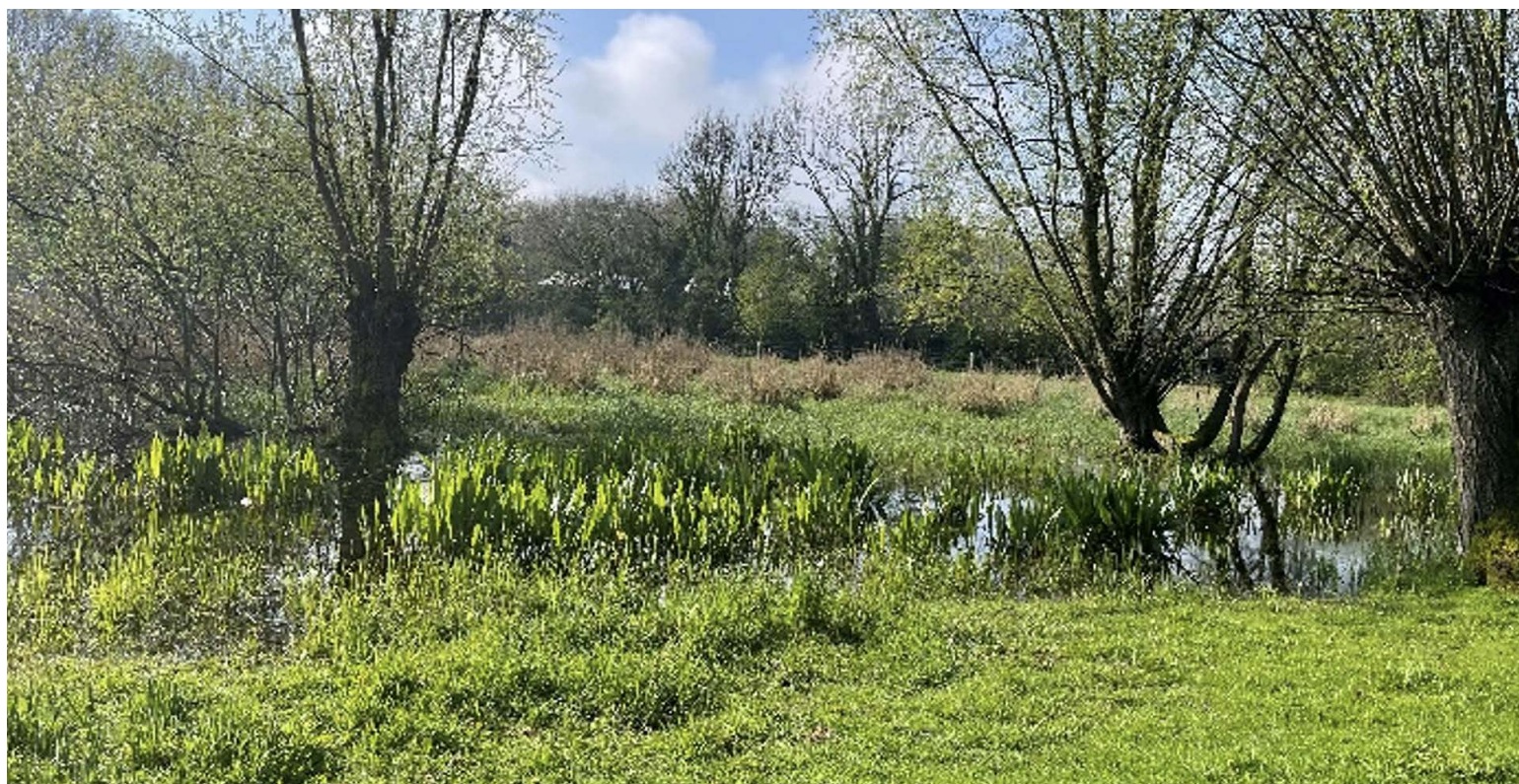
Exemple de zone humide.

Un suivi du parasitisme interne pour les espèces bovins, équins et petits ruminants est proposé en partenariat avec le réseau Vet'el. Ainsi les éleveurs peuvent bénéficier d'analyses de laboratoires (analyse de sang et coproscopies) prises en charges, suivies d'un audit annuel, réalisé par un vétérinaire du secteur. Cet accompagnement vise à aider les éleveurs à raisonner l'usage des produits antiparasitaires qui peuvent être